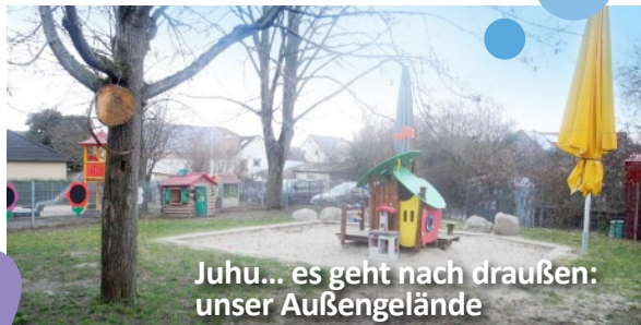
Juhu... es geht nach draußen: unser Außengelände